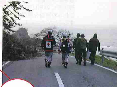
▲寸断された道路を自衛隊員と進む同救護班(石川県珠洲市)