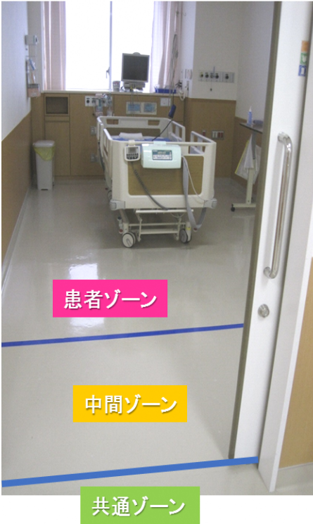
病室ゾーニングの1例