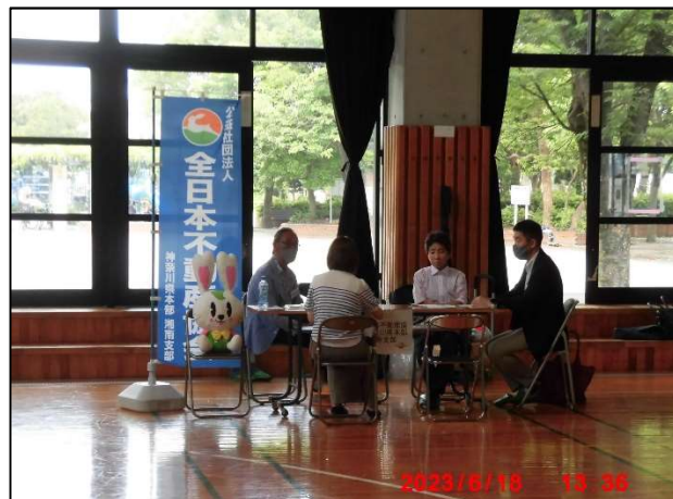
空家に関する様々な相談を受ける専門家団体