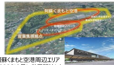
上：阿蘇くまもと空港周辺エリア 右：2023年3月に供用開始した阿蘇くまもと空港の新旅客ターミナルビル