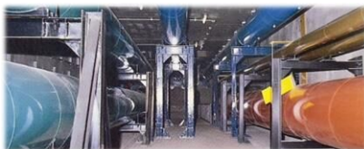
筑波研究学園都市の地域冷暖房共同溝