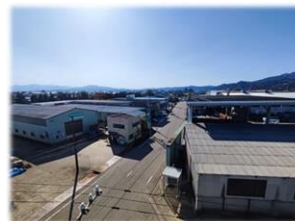
福岡金属工業団地