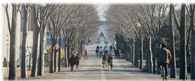
筑波研究学園都市の並木道