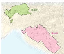
国選定重要伝統的建造物群保存地区