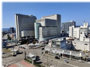
高岡市中心市街地