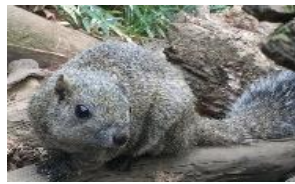
タイワンリス など