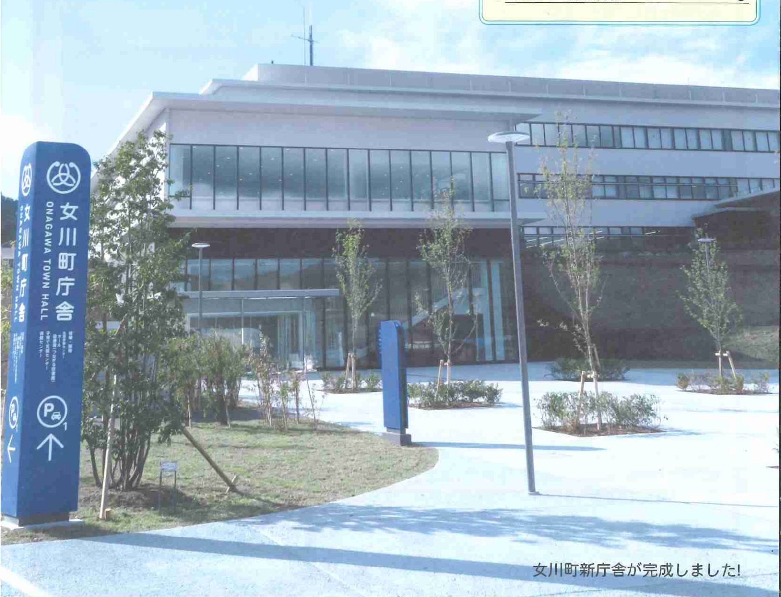
女川町新庁舎が完成しました!