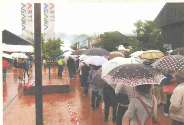
▲当日は雨が降っていましたが、大勢の来場者が会場を訪れました。