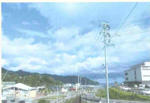
▲向かって左側が女川駅。右側が新庁舎。駅にほど近く、高台に建てられています。

生涯学習センターは412席のホールと蔵書8万冊の図書室からなり、ホールは災害時に支援物資の仮置き場としても活用されるなど、災害対策の拠点機能も備えています。また、原子力発電所の立地町として、放射線の防護設備が整備された災害対策室が庁舎2階に設けられました。