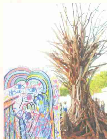
▲会場には“アート”にちなんだ作品が展示されていました。手前のボードは来場者が自由に描いたものです。