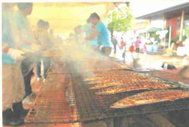
▲次々に焼かれる秋刀魚。会場内には秋刀魚の芳ばしい香りが立ち込めていました。

今年で21回目の開催となった「おながわ秋刀魚収穫祭」。震災があった2011年も、また、歴史的な秋刀魚の不漁年となった昨年も中止をすることなく、女川の秋の風物詩として毎年開催されてきました。今年も9月30日に開催され、会場となった女川駅前商業エリアには、大勢の観光客が訪れていました。来場者には、昨年同様、炭火焼きの秋刀魚10,000尾とすり身汁4,000杯が振舞われ(募金制)、会場は大いに賑わいました。集まった募金の総額は623,057円。この募金は海難遺児育英支援と災害被災地支援に充てられます。