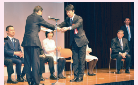
ふるさと納税未来大賞を受賞する岩手県総務部長

平成 28 年 2 月 11 日（木）、東京都内で「ふるさと・いいこと・フェア」（ふるさと知事ネットワーク主催）が開催され、岩手県の「いわての学び希望基金」の取組が、ふるさと納税制度を有効に活用して優れた取組を行っている自治体として「ふるさと納税未来大賞」を受賞しました。「いわての学び希望基金」はふるさと納税制度などにより全国の皆様から寄付をいただき、被災地の子ども達への様々な支援に活用されています。