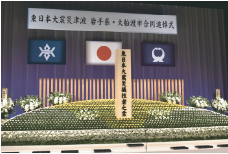
追悼式会場に設けられた祭壇