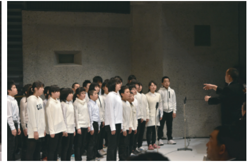
献歌を捧げる児童

東日本大震災津波から 5 年を迎えた平成 28 年 3 月 11 日（金）、岩手県と大船渡市の合同追悼式が大船渡市民文化会館（リアスホール）（同市盛町）で開催され、ご遺族や関係者等約 730 人が参列しました。