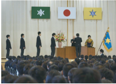
卒業証書を受け取る生徒