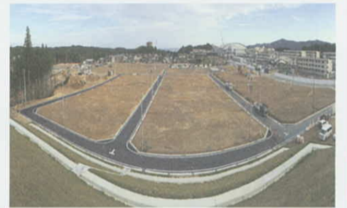
南三陸町志津川東団地（西工区）

毎月更新の「復興の進捗状況」は、県ホームページでご覧いただけます。 http://www.pref.miyagi.jp/site/ej-earthquake/shintyoku.html