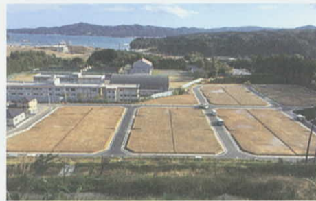
南三陸町志津川西団地（東工区）