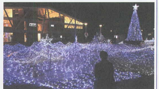
12月16日 スターダストページェント2016海ほたる(女川町)