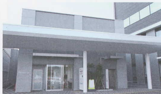
12月1日 夜間急患センターが移転オープン(石巻市)