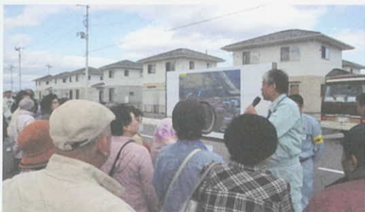
10月29日 関上復興住宅見学会(名取市)