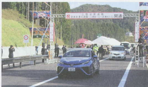
10月30日 登米志津川「三滝堂IC~志津川IC間」開通