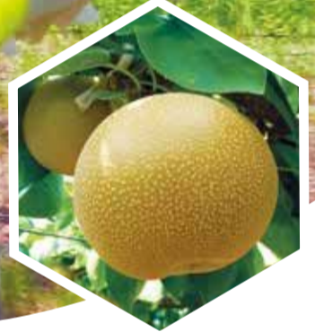
さわやかな甘み 日本ナシ

藤沢のナシは「幸水」が8月上旬から出回り、その収穫が終わると「豊水」「あきづき」と晩成品種に切り替わっていきます。