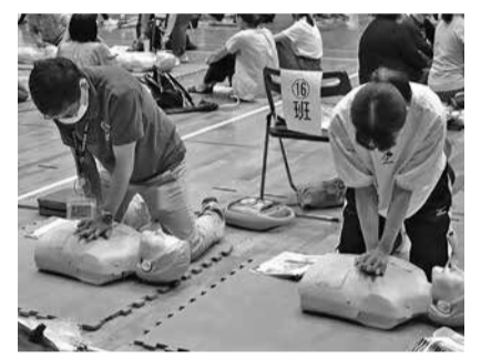
防署・各出張所、各市民センター・公民館に来庁で

とき 9月14日(土)午前9時～正午 ところ 秩父宮記念体育館 内容 医師の講話、成人または乳幼児に対する救命講習(心肺蘇生法、AEDの使用法) 対象・定員 市内在住・在勤・在学の中学生以上の方300人(先着順) 費用 無料 申し込み 7月19日(金)～9月4日(水)に市のホームページの「電子申請・申請書ダウンロード」から、または南・北消防署・各出張所、各市民センター・公民館に来庁で