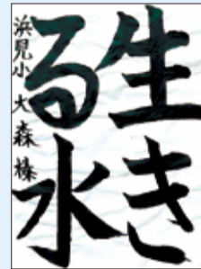
大森 榛 (浜見小)