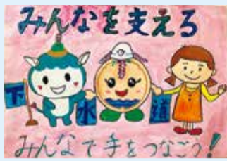
片山 実咲 (村岡小)