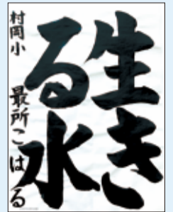
最所 心遥 (村岡小)