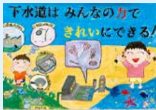
道祖土 雅之 (羽鳥小)