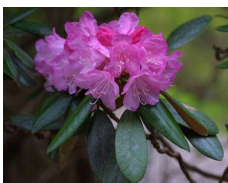
シャクナゲ (ツツジ科) Rhododendron metternichii var. 花期：春 常緑 腐食質に富んだ水はけのよい弱 酸性土壌を好む。乾燥に注意。 花は大型で美しい。