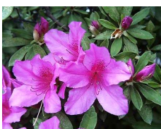
ヒラドツツジ (ツツジ科) Rhododendron spp. 花期：春 常緑 耐寒性に優れるが、夏期の 高温乾燥にあうとツツジグ ンバイ、ハダニが発生する ので注意。成長は早く、大 気汚染に強い。