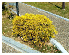
フィリフェラオーレア (ヒノキ科) Chamaecyparis pisifera cv. Filifera Aurea 黄色の葉が美しい。 日向を好む。乾燥に弱い が過湿にも弱い。