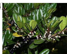
ハマヒサカキ (ツバキ科) Eurya emarginata 花期：秋～冬 常緑 成長はやや遅い。 枝葉は密で耐潮性があり、 大気汚染に強い。