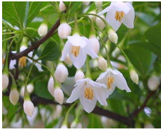
エゴノキ (エゴノキ科) Styrax japonica 花期：春 落葉 成長はやや早く、成長が止まる くらい花付きと結実が旺盛。果皮 は有毒なので注意。