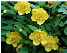
ヒペリカム (オトギリソウ科) Hypericum patulum 花期：夏 常緑 地下茎を伸ばして増え密に 被覆するので、面的な利用 に向いている。 日向を好む。サビ病に注意。