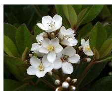
シャリンバイ (バラ科) Rhapsiolepis umbellata 花期：晩春～初夏 常緑 白いウメに似た花が咲き、 芳香がある。 耐潮性に優れ、海岸植栽に 適する。樹形は横広がり。