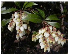
アセビ (ツツジ科) Pieris japonica 花期：春 常緑 耐陰性・耐寒性がある。 スズランのような花が美しい 葉に毒がある。 刈り込みに耐える。