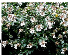
アベリア (スイカズラ科) Abelia X grandiflora 花期：夏～秋 常緑 地際でよく分枝して倒卵形 の樹形となる。 乾燥には極めて強く刈り込 みによく耐える。 花期が長く昆虫を招く。