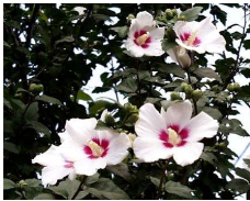
ムクゲ (アオイ科) Hibiscus syriacus 花期：夏～秋 落葉 花は一日花だが次から次へ と咲き期間も長い。 成長が早く、強い。