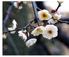
ウメ (バラ科) Prunus mume 花期：初春 落葉 成長が遅い。 アブラムシ、コスカシバに 注意。 強剪定で花付きがよくなる。