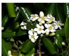
トベラ (トベラ科) Pittosporum tobira 花期：春 常緑 耐潮性・耐乾性があり、刈 り込みによく耐え海岸植栽 にも適する。カイガラム シ、アブラムシに加害され るとすす病が発生しやす