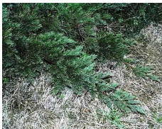
ハイバクシン (ヒノキ科) Juniperus chinensis var. procumbens 枝が地を這って長く伸び、 低い地被となる。 耐潮性があり、管理も容易。