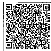
亀井野子ども教室HP