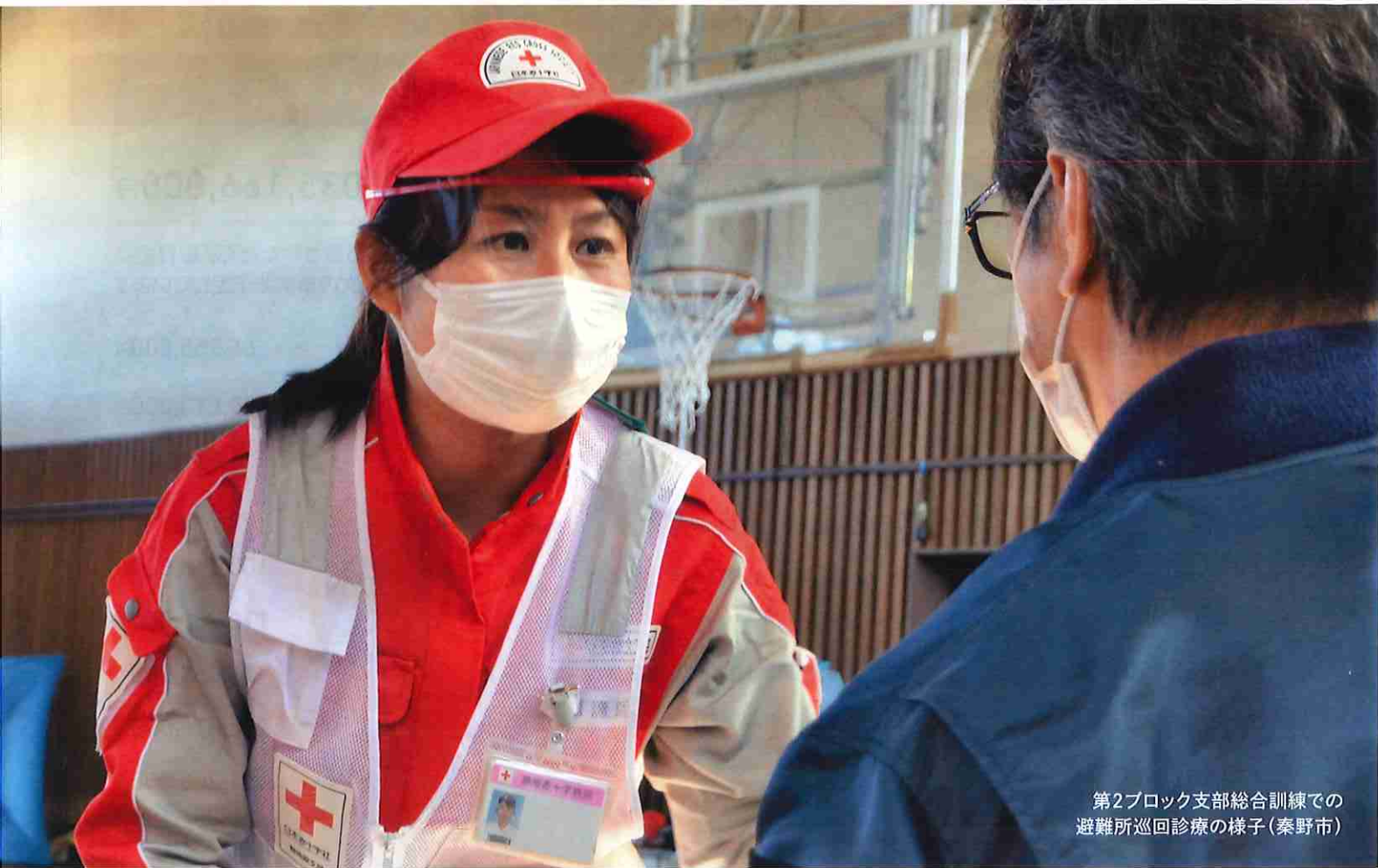
第2ブロック支部総合訓練での 避難所巡回診療の様子(秦野市)