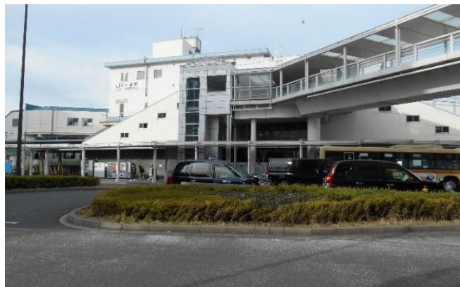
現在の様子(令和6年)