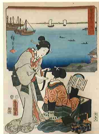
歌川国貞(三代豊国)、歌川広重 「双筆五十三次品川」