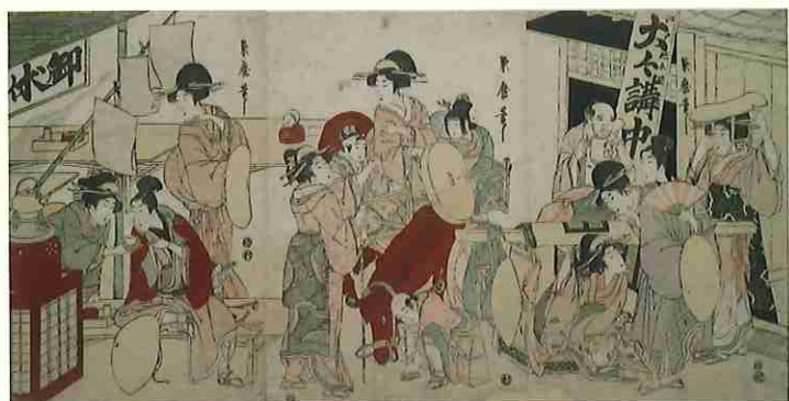
喜多川菊麿「題名不詳(大々講中)」